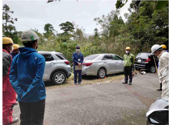
(下越森林管理署長 御挨拶・安全指導)