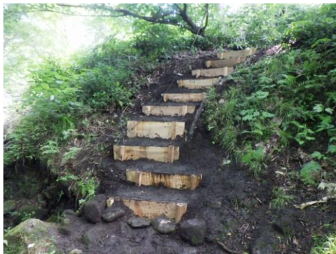
新たな木製階段の設置作業完了